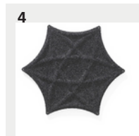
1. Airflake XL, blade open 2. Airflake, blade closed